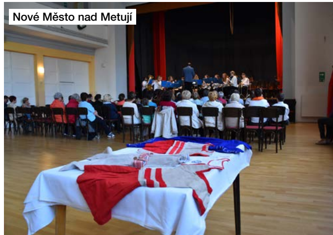
Nové Město nad Metují