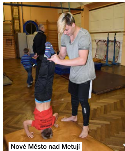
Nové Město nad Metují

večeře. Po ní se děti uložily do spacáků a zhlédly pohádku. V sobotu po snídani se děti rozešly domů, aby mohly přijít na poslední akci tohoto týdne.